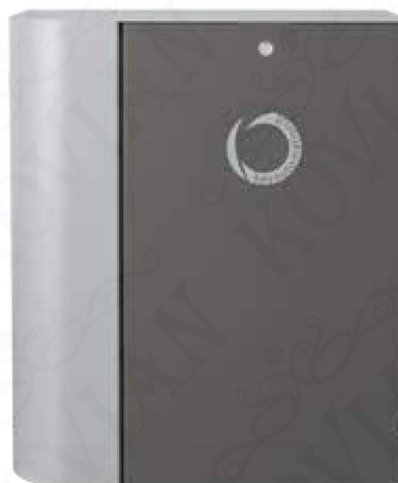
Rozměry pohonu TURBO400

Elektronické a mechanické komponenty jsou chráněné před povětrnostními vlivy. Ovládací panel je uložený v pozici, která zaručuje snadnější přístup. Elektronická brzda zaručuje bezpečnost provozu i při automatizaci těžších bran. Nová řídicí jednotka 400 Vac CT400.